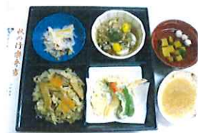
秋の行楽弁当(松茸ごはん)