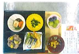
敬老の日 祝い弁当