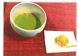
お抹茶とお茶菓子を提供