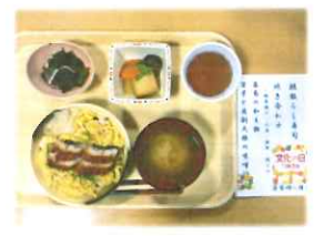
文化の日 (鰻散らし寿司等)