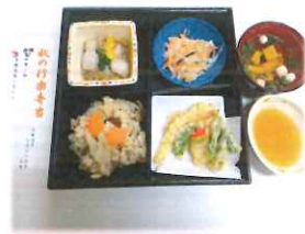
秋の行楽弁当 (松茸ご飯等)